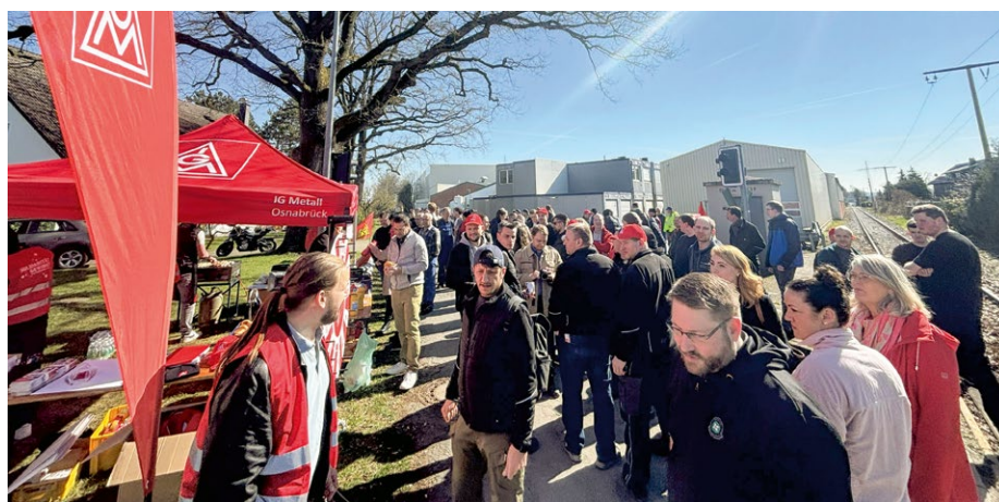
Aktionstag bei Kesseböhmer in Böhnte

Zusammen sind wir viele. Zusammen können wir etwas bewegen. Jetzt geht es darum, dranzubleiben!