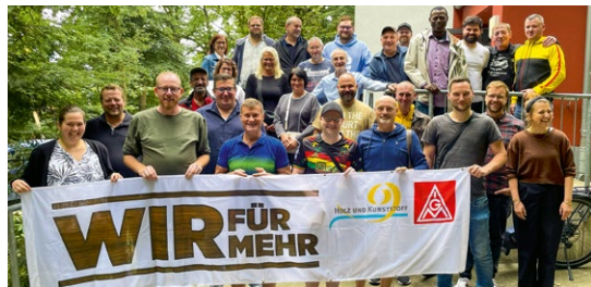
Aktion in der Tarifrunde bei Teutofracht

In Oesede an der Glückaufstraße geht der Kampf für gute Arbeitsbedingungen in die nächste Runde. Nach der erfolgreichen Tarifrunde in der Holz und Kunststoff verarbeitenden Industrie zeigt sich: